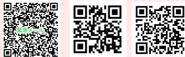
チラシ 日本語 English

勝山市のホームページから『メール』と検索すると勝山市緊急メールサービスがでできます。下のQRコードからも登録ができます。