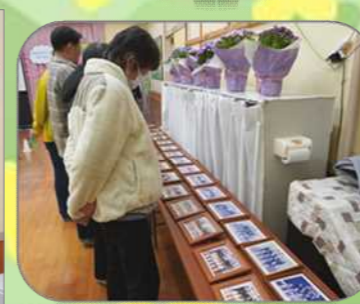
保育園一般公開の様子