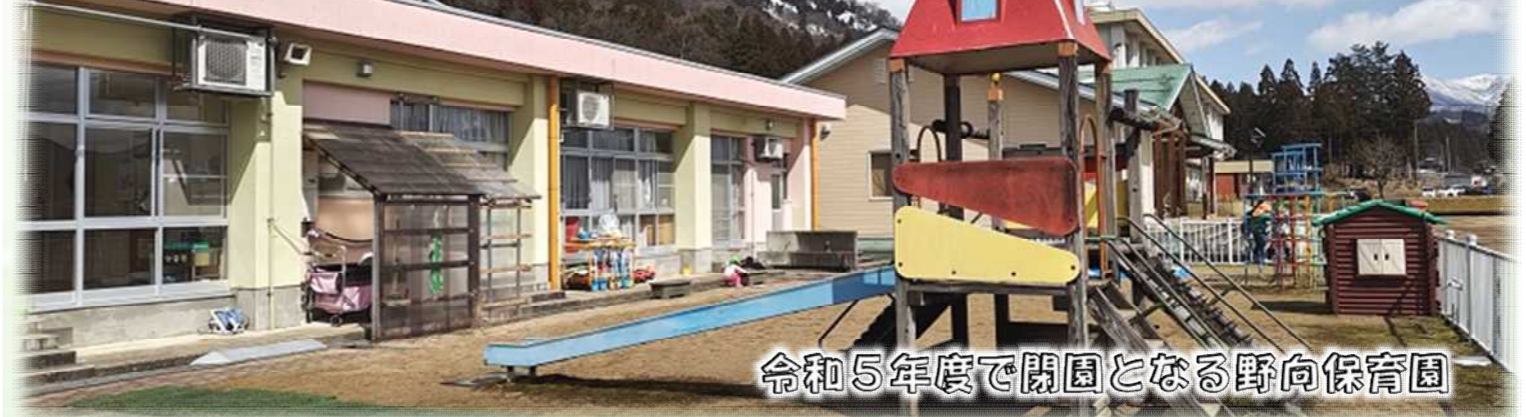
令和5年度で閉園となる野向保育園