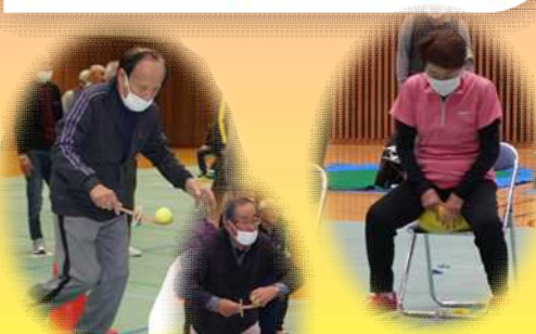
風船わり競争 スプーンリレー

11月14日(火)ジオアリーナにて市高連運動会が行われました!野向は総合成績は3位(1位獲得数の差で惜しくも3位でした)。競技は5種目。皆さん懸命に体を動かして楽しまれていました。