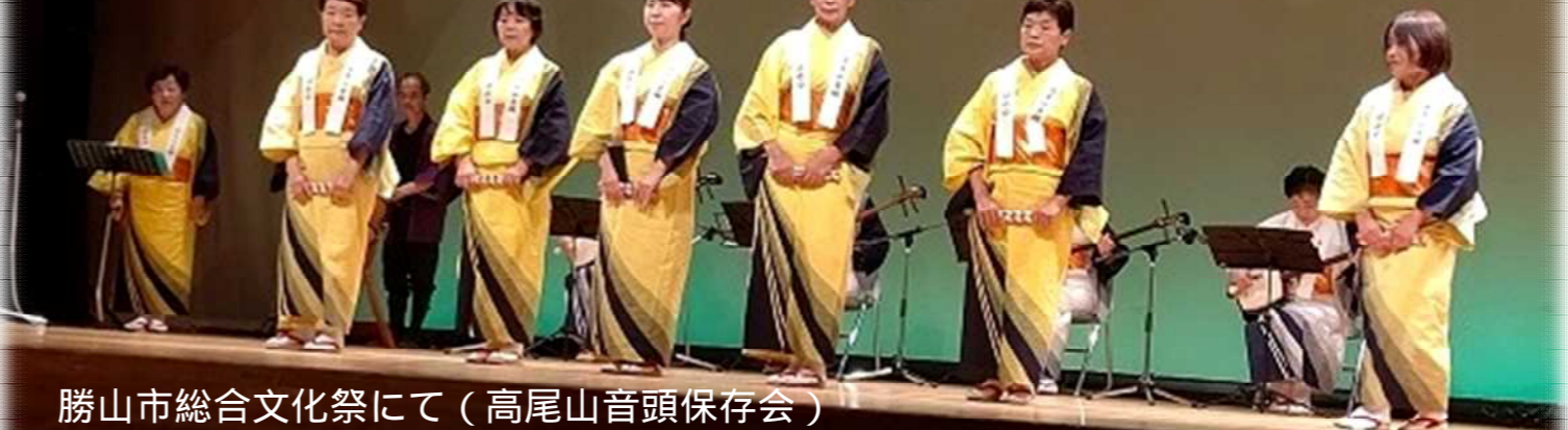
勝山市総合文化祭にて(高尾山音頭保存会)

11月5日(日)野向小学校におきまして野向町民文化祭が開催されました! 秋晴れの中たくさんの方が来場され、発表や展示・模擬店など野向地区らしい温かい雰囲気を楽しむことができましたね。ご参加いただきありがとうございました。