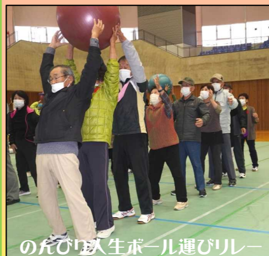
のむき人生ボール運びリレー